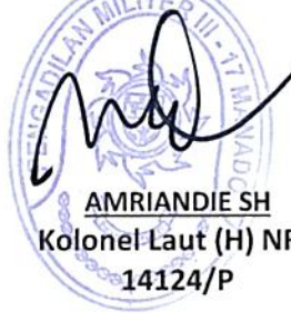
AMRIANDIE SH Kolonel Laut (H) NRP 14124/P

KETUA PENGADILAN TATA USAHA NEGARA MANADO